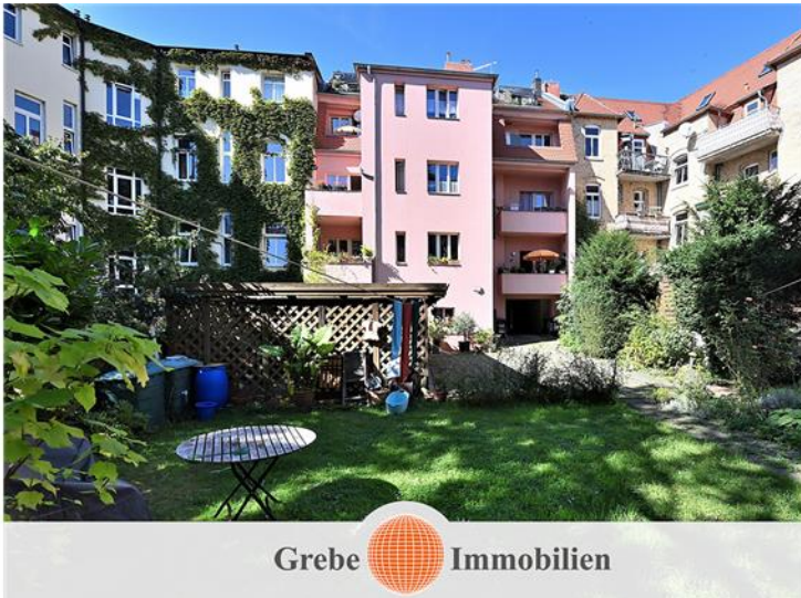
grüne Oase für Mieter