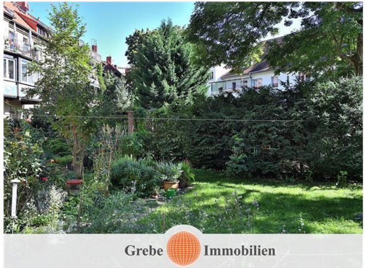
Einfriedung gesamtes Grundstück